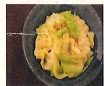
だしうまキャベツ