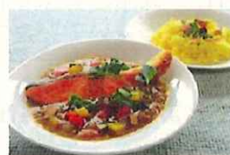
秋鮭と大豆ソーセージ、野菜のスープカレー