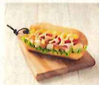
スクランブルエッグとたっぷり野菜のバイザンヌサラばん