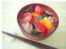
ふくしまの野菜が主役のみそ汁