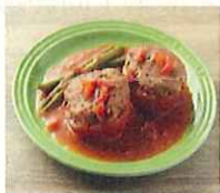
丸ごとトマトのハンバーグ